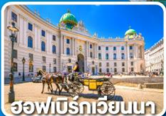
ฮอฟเบิร์กเวียนนา