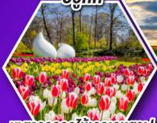
เทศกาลดอกไม้เคเคนฮอฟ