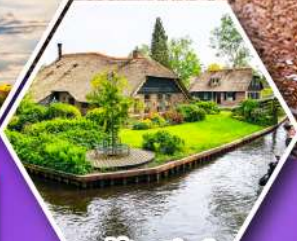
หมู่บ้านกังธูร์น