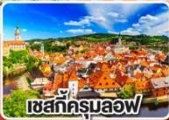
เซสท์ครุมลอฟ